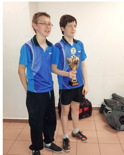
Tableau B - 1er US SANDILLON 1

La finale du tableau A a été remportée par PING ST JEAN 45 2