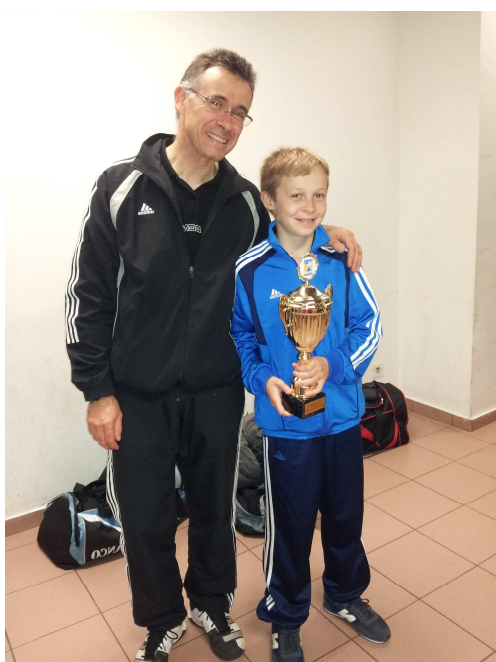
Tableau B - 1er US SANDILLON 1