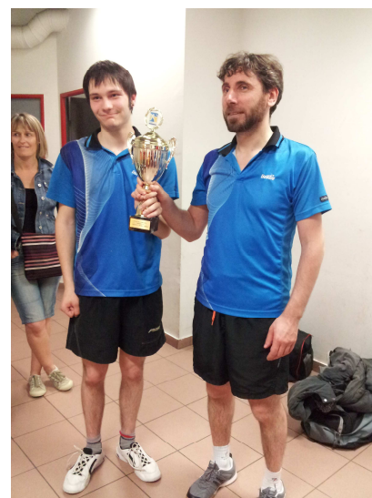
Tableau C - 1er PING ST JEAN 3